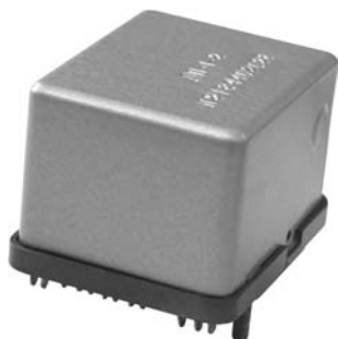
Переключатели дистанционные серии ДП-1

Переключатели дистанционные серии ДП-1 предназначены для коммутации электрических цепей: постоянного и переменного тока (частотой от 400 до 1000 Гц) – переключатели типов ДП-1-2, ДП-1-2А, ДП-1-25, ДП-1-50А, ДП-1-100; постоянного тока – переключатели типов ДП-1-10, ДП-1-50, ДП-1-50Б.